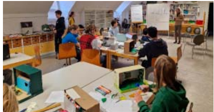
Themen-Workshop des Netzwerks zur Ausstellungsgestaltung (links); Herbstworkshop des Kinder- und Jugendbeirats (rechts)