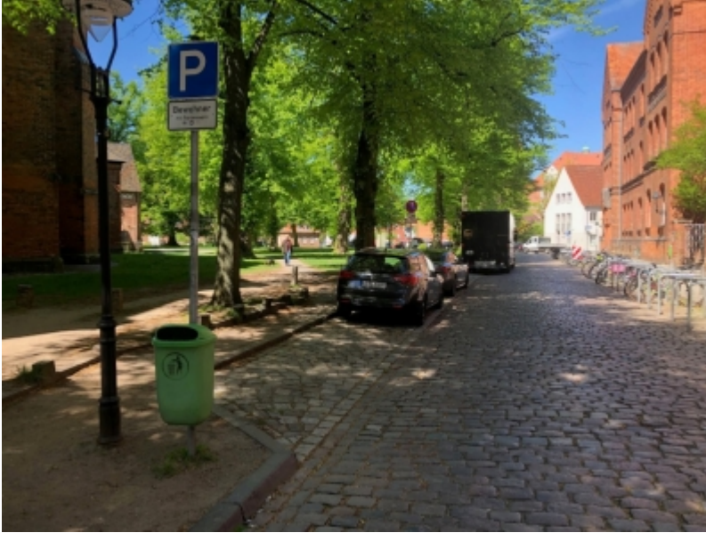
Abb. 3: Neuer Standort Domkirchhof

und Pferdemarkt 17 Fahrradbügel eingebaut.