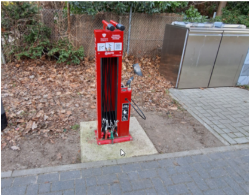
Abb. 5: Reparaturstation auf dem Gelände der GGS St. Jürgen

Für die Emanuel-Geibel-Schule ist der Auftrag zum Einbau der Station erteilt. Die Station der