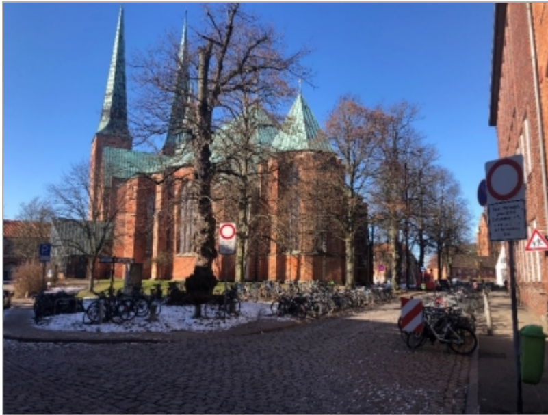
Abb. 2: Domkirchhof, 19.03.2025

Zusätzlich sollen die vor der Dom-Schule vorhandenen, oftmals leeren Fahrradbügel von den Schüler:innen der OzD genutzt werden.