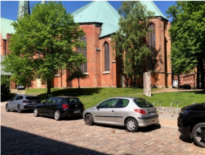
Abb. 4: Neuer Standort Musterbahn