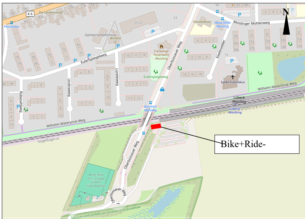
Abb.: Lage der Bike+Ride-Anlage Lübeck-Moisling Süd

Der Neubau einer kleineren B+R-Anlage mit 48 Stellplätzen auf der Südseite ist als Anlage in Modulbauweise aus dem Bike+Ride-Programm der Landesweiten Nahverkehrsgesellschaft NAH.SH vorgesehen. Zwei Anlagen dieses Modells sind seit einigen Jahren bereits an den Bahnhofspunkten Lübeck-Hafen und Lübeck-Skandinavienkai in Betrieb.