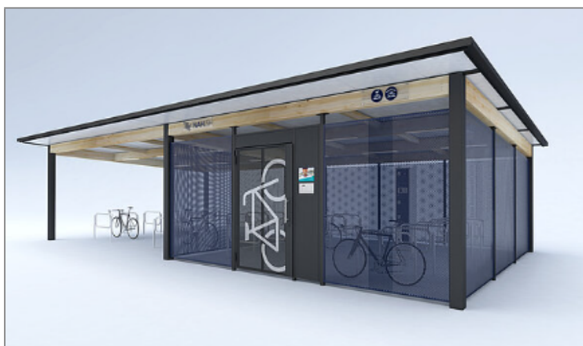
Abb.: Ansicht der B+R-Anlage