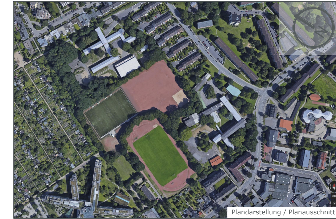
Planarstellung / Planausschnitt