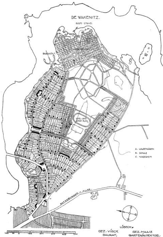
Siedlung an der Gärtnergasse