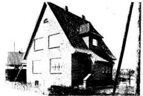
1. Wohnblock Ebert-Hof des Bauvereins „Selbsthilfe“ e. V., Lübeck, Architekt: Berg, Hamburg 2. u. 3. Siedlungshäuser des Bauvereins „Selbsthilfe“ e. V., Lübeck 4. 6. 7. Siedlungshäuser der Gemeinnützigen Siedlungsgenossenschaft e. G. m. b. H. 5. Siedlungshaus der Gewerkschaftshaus G. m. b. H., Lübeck