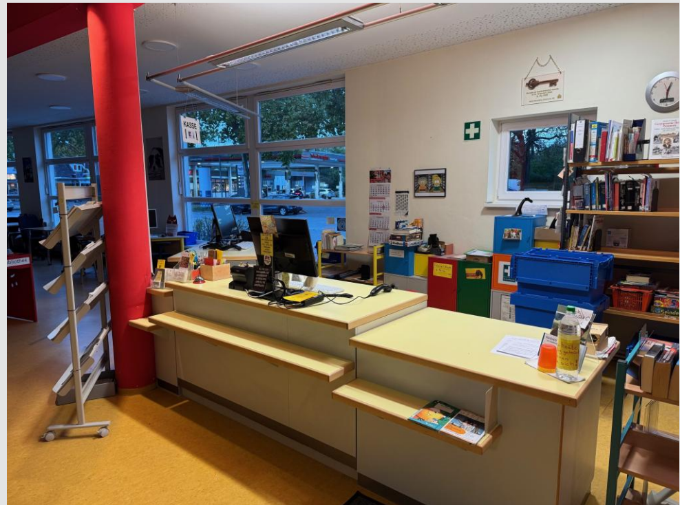
Neue alte Theke in Küchnitz / Upcycling-Projekt

Über alle diese Neuigkeiten informiert der Bereich auch im monatlichen Newsletter der Stadtbibliothek