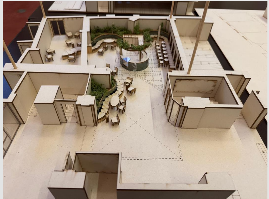
(BA-Thesis HS Wismar SS2025 - Ein Café für die Stadtbibliothek / 3D Holzprint von Emilia Basse)

Ergebnisse der Design Thinkings, Ergebnisse vorhandener Umfragen und Arbeitsergebnisse der Studierenden der HS Wismar „Fachrichtung Innengestaltung“ fließen mit ein, sowie Umbaupläne von GMHL fließen mit ein.