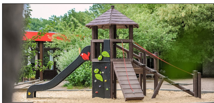
Abb.: Beispielbild 2 für Einzelgerät