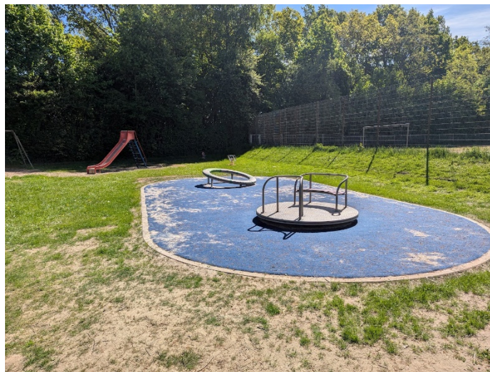
Abb.: Beispielbild für Karussell mit Fallschutz (Teppichflies)