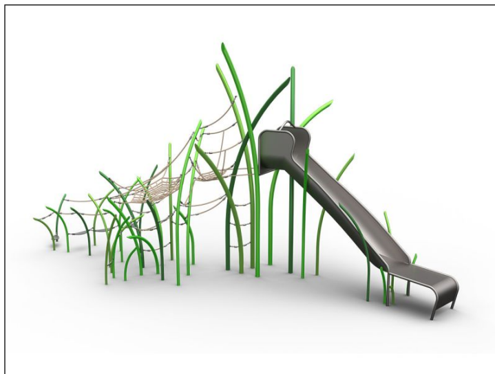
Abb.: Beispielbild 1 für Einzelgerät