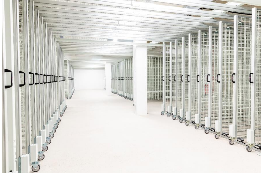
Foto: Noch leerer Depotraum für Gemälde im neuen Zentraldepot der Stadt Darmstadt

Kunstwerke und Naturobjekte müssen konservatorisch einwandfrei gelagert werden, damit diese noch zukünftigen Generationen zur Verfügung stehen. Dazu braucht es energieeffiziente und sichere Depoträume. Diese fehlen noch in Lübeck.