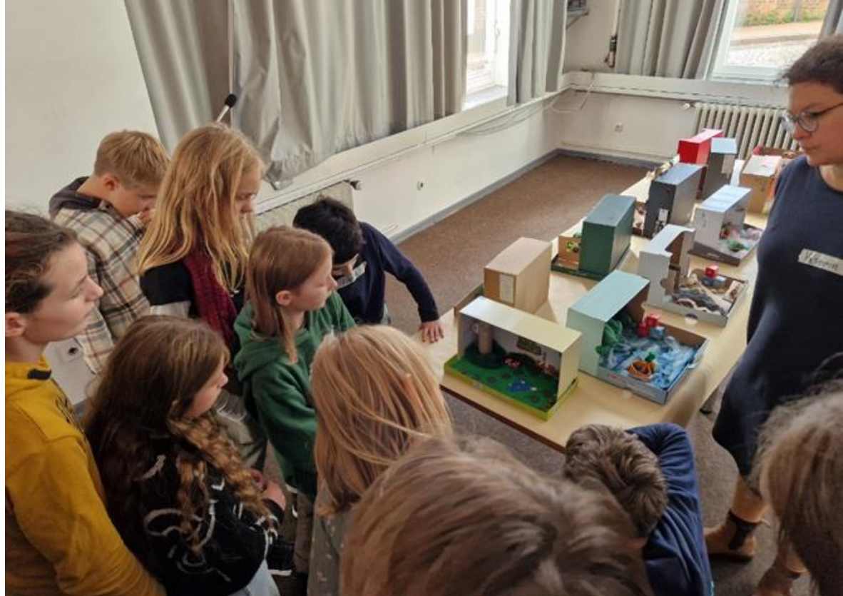
Foto: Kinder im Museum für Natur und Umwelt präsentieren ihre Traumräume

Auch das „Bilden“ ist einer der Grundsätze der Museumsarbeit nach ICOM und Nachhaltigkeitsziel UN. Museen sind außerschulische Bildungsorte, zudem Bildungseinrichtungen, die allen Menschen offenstehen.