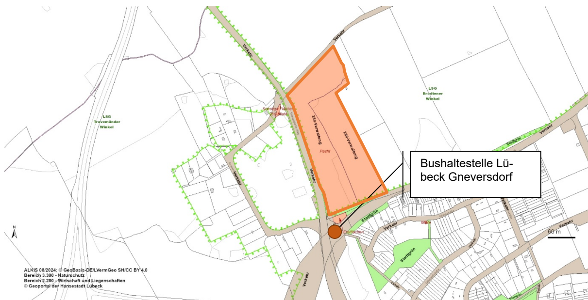
Abb. 2: Verortung des potenziellen Behelfsparkplatzes am Howingsbrook (orange eingefärbt), © GeoPortal Lübeck

gen zur Verfügung stünden. Südlich grenzt die Bushaltestelle Lübeck Gneversdorf an, wodurch die Fläche über eine direkte Anbindung an das ÖPNV-Netz verfügt. Die Bushaltestelle wird aktuell im Regelbetrieb von der Buslinie 30 angebunden, die im Halbstundentakt verkehrt und u. a. den Strandbahnhof, als auch die Priwallfähre in Travemünde anfährt.