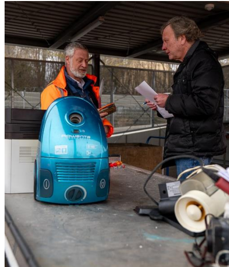
Lübeck, 13. März 2025