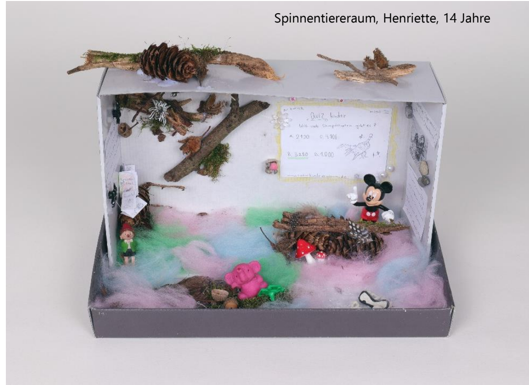
Spinnentiereraum, Henriette, 14 Jahre