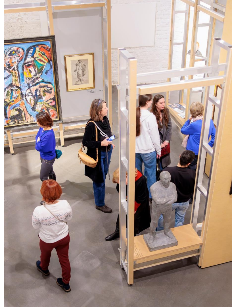
Abb. Ausstellungsansicht, "Hello Lübeck", Kunsthalle St. Annen 2023.