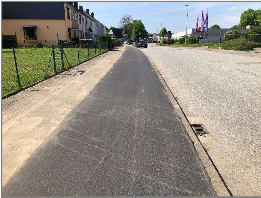
Abb.: Memelstraße, Zweirichtungsweg