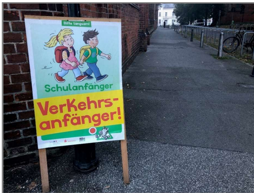
Abb.: 50. Jubiläumsaktion „Schulanfänger – Verkehrsanfänger“