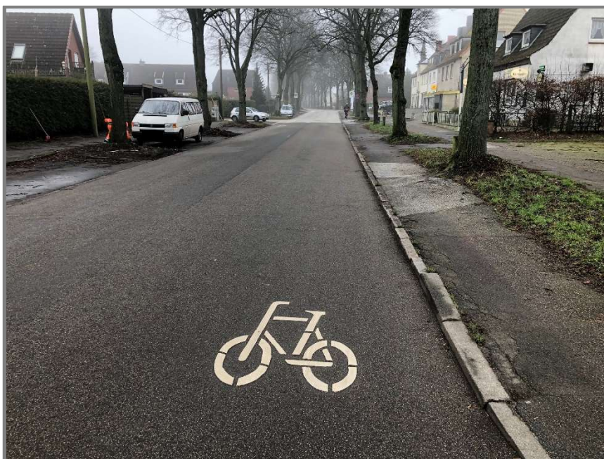
Abb.: Aufhebung der Radwegbenutzungspflicht in der Dummersdorfer Straße