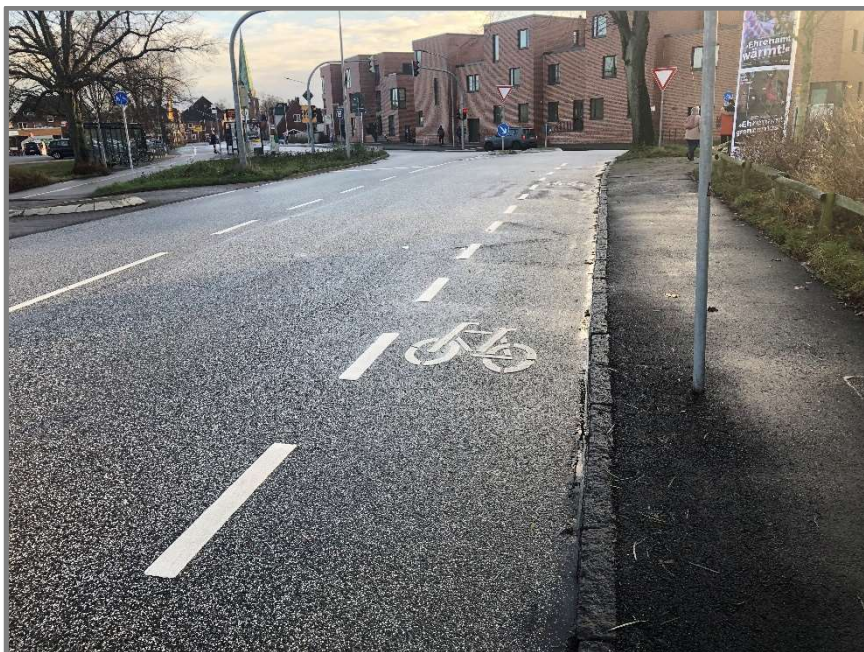
Abb.: Teutendorfer Weg/Travemünder Landstraße