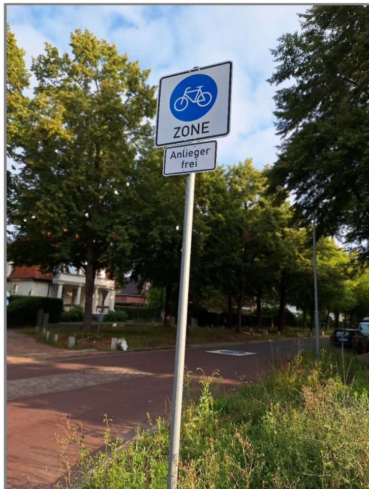
Abb.: Jürgen-Wullenwever Straße