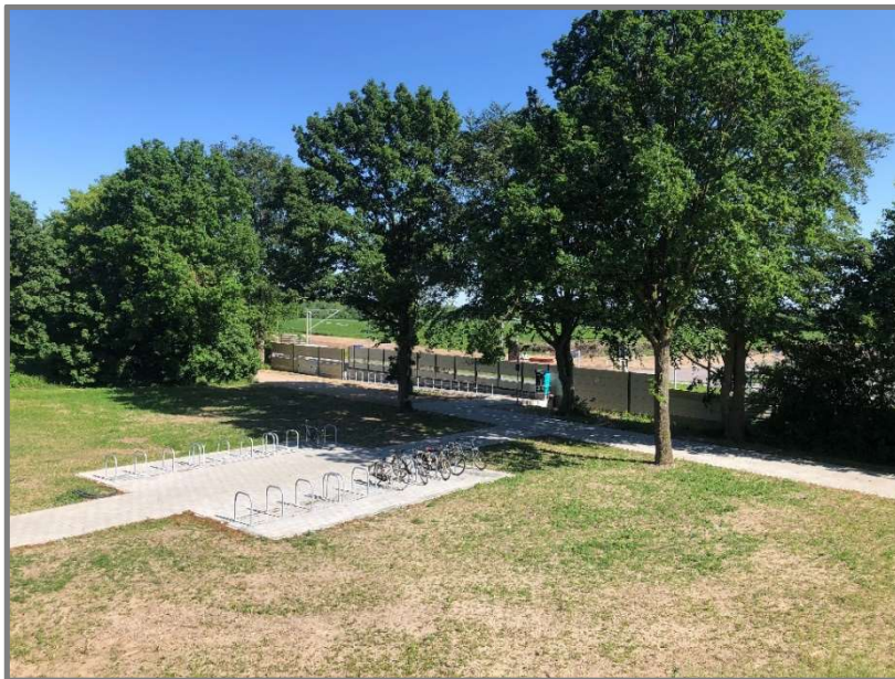
Abb.: Fahrradbügel auf Schienen am Bahnhaltelpunkt Moisling Nordseite