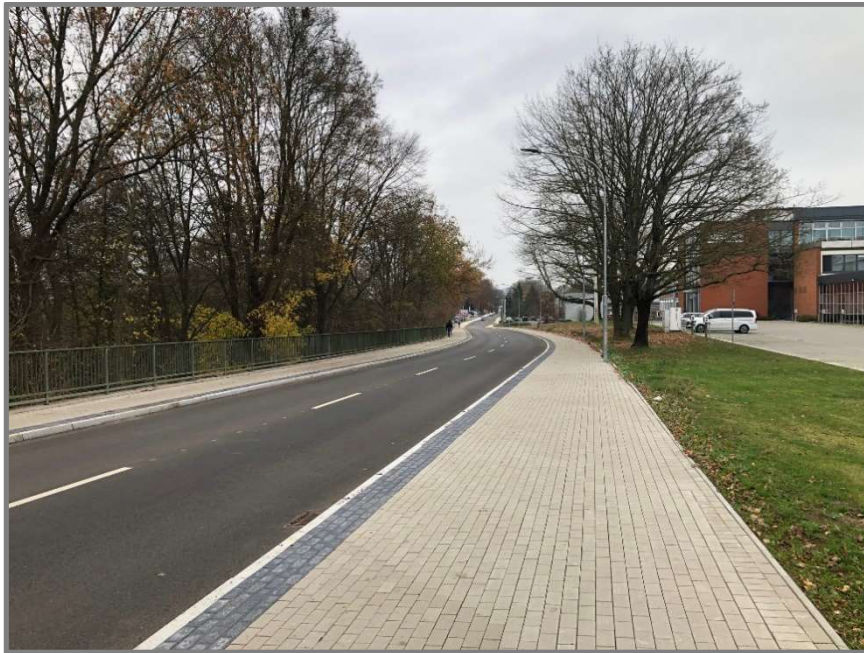
Abb.: Geniner Straße, beidseitige gemeinsame Geh- und Radwege