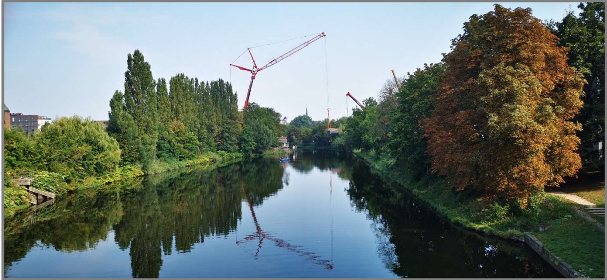
Abb.: Einhub Stadtgrabenbrücke