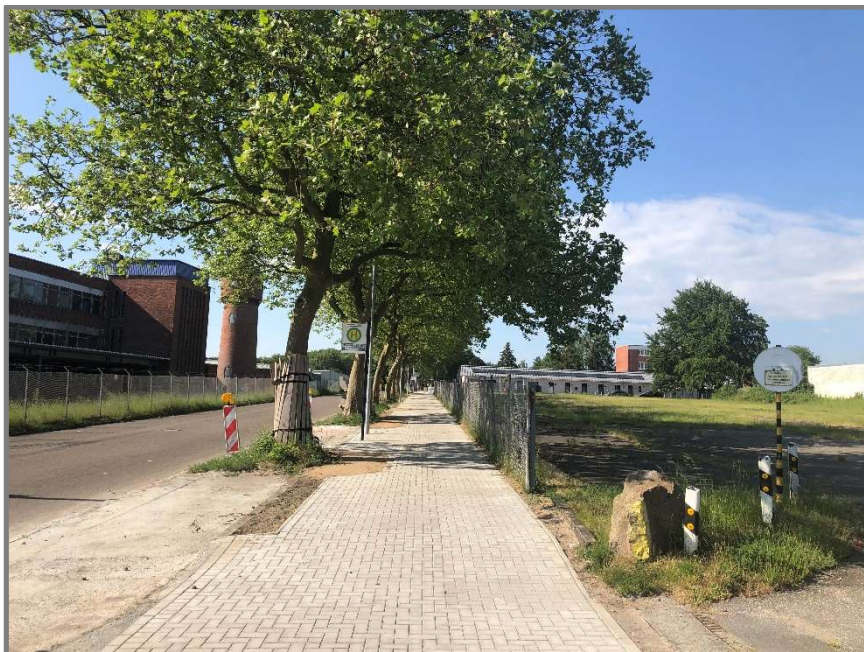
Abb.: Glashüttenweg, gemeinsamer Geh- und Radweg