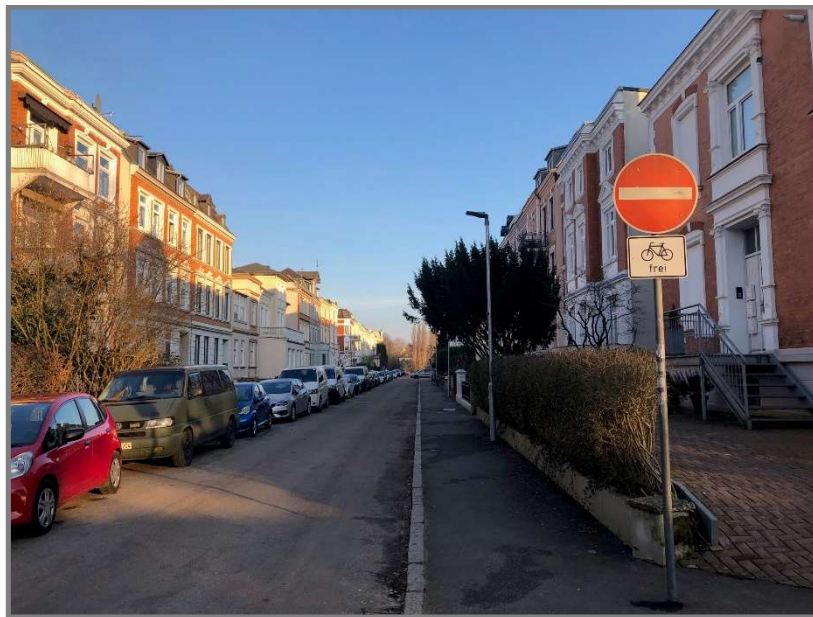
Abb.: Freigabe des Gegenrichtungsradsverkehrs in der Seydlitzstraße