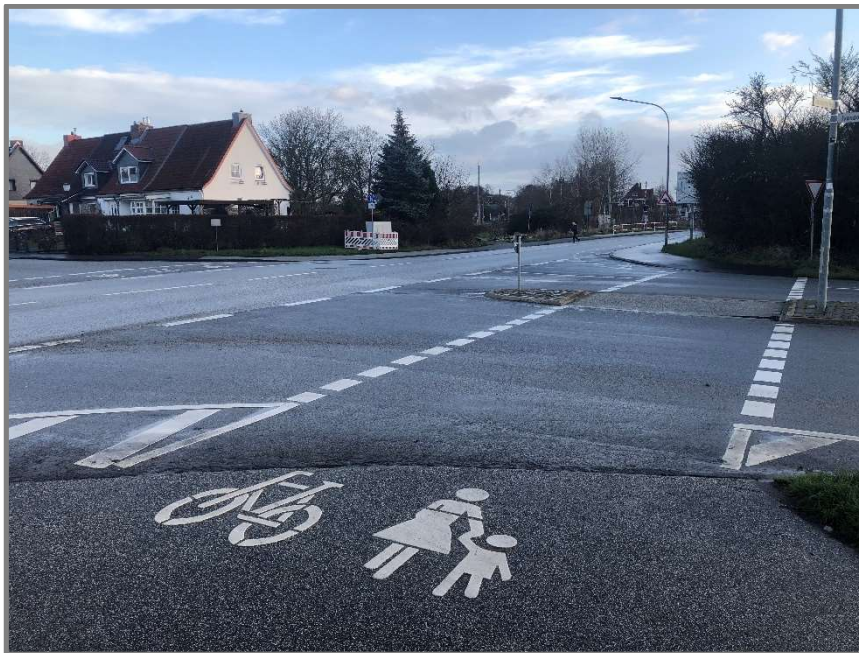
Abb.: Teutendorfer Weg/Ivendorfer Landstraße