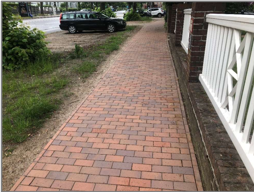
Abb.: Gehweg am Moltkeplatz