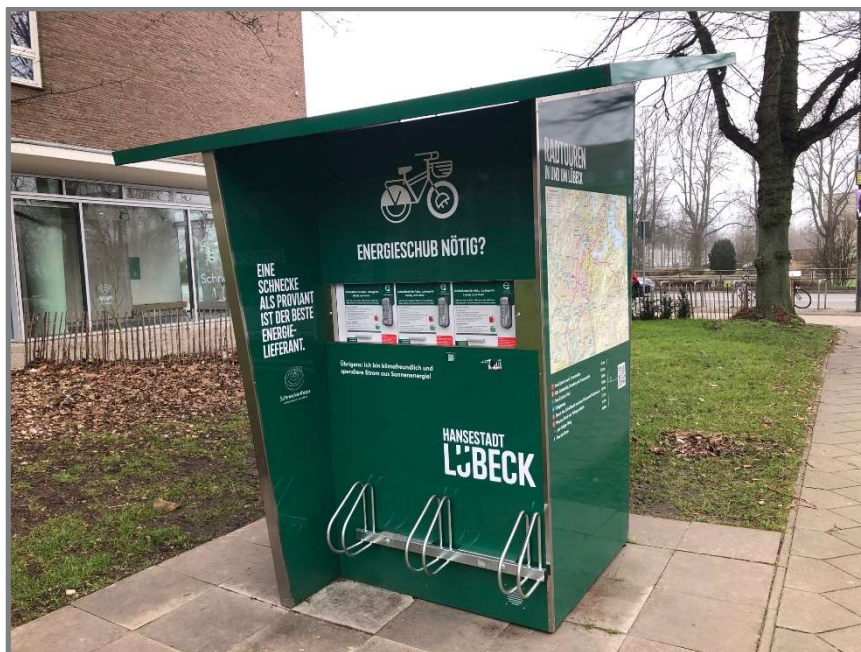
Abb.: E-Ladesäulen am Holstentorplatz vor der Touristeninformation