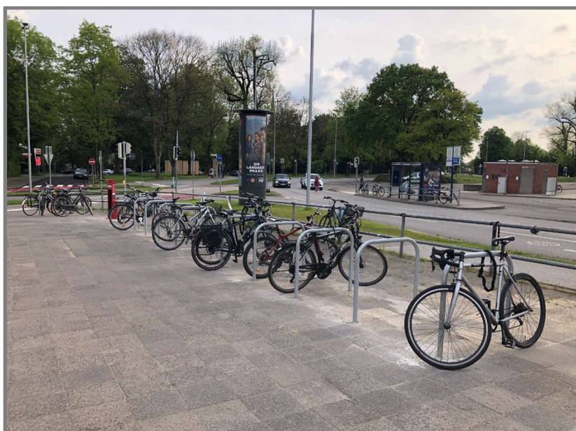
Abb.: Fahrradbügel und Fahrradreparaturstation am Gustav-Radbruch-Platz