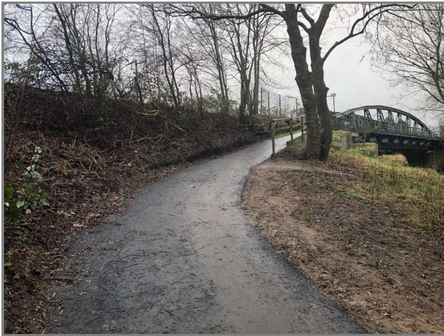
Abb.: Rampe Eisenbahnbrücke Genin