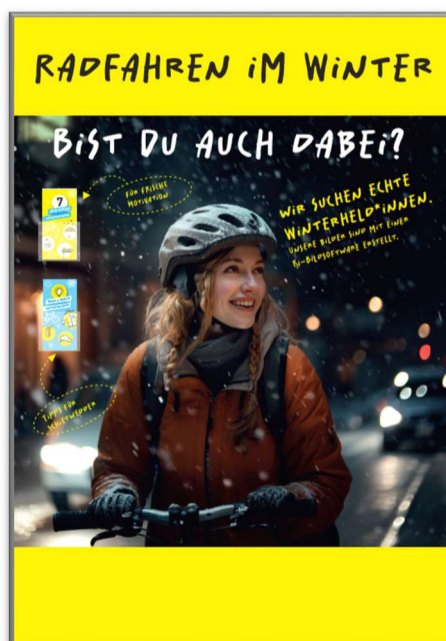
Abb.: Aktion „Winterhelden gesucht“, Quelle: RAD.SH