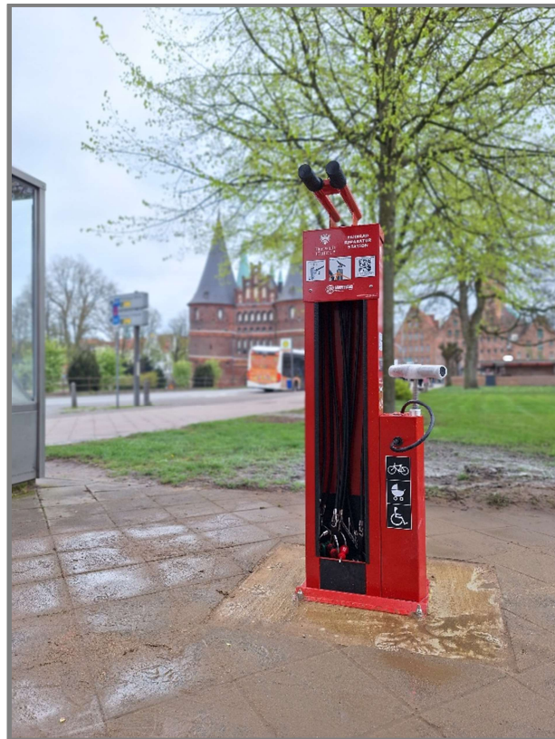
Abb.: Fahrradreparaturstation am Holstentor