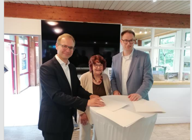
Vertragsunterzeichnung am 17.07.2024