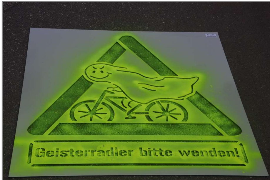
Abb.: Schablone Geisterradler-Aktion