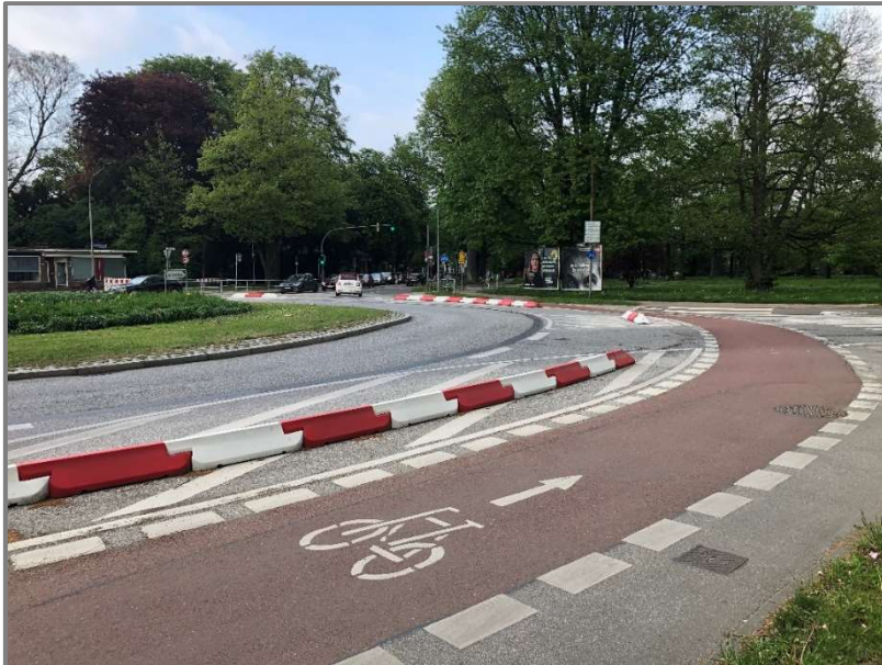
Abb.: Mühlentorplatz mit neuer Markierung und Trennelementen