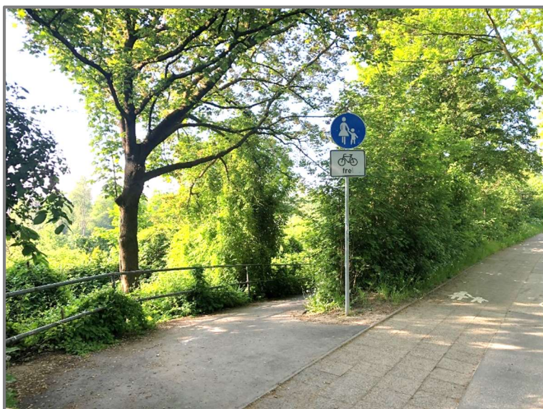
Abb.: Sanierte Rampe Wallbrechtbrücke