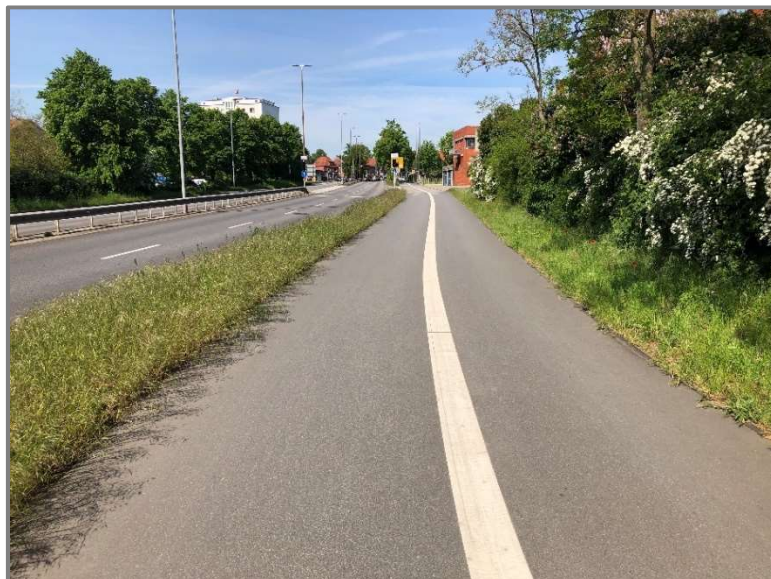
Abb: Sanierter Geh- und Zweirichtungsradweg Stockelsdorfer Straße