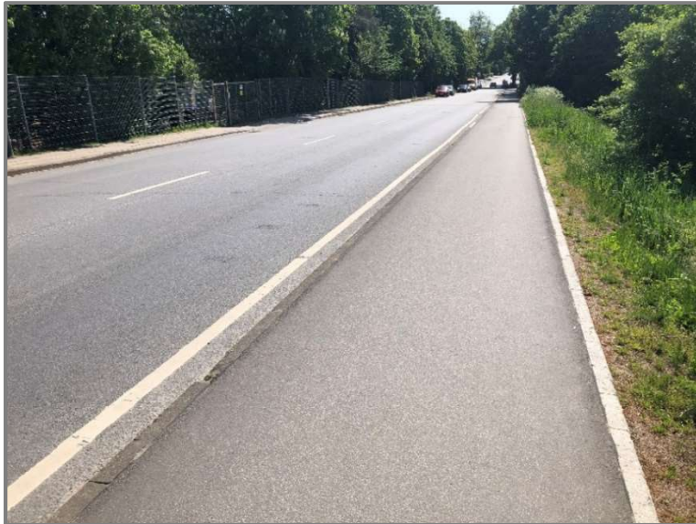
Abb.: Sanierter Geh- und Zweirichtungsradweg Vorwerker Straße