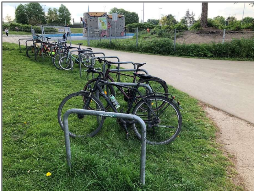
Abb.: Neue Fahrradbügel am Sportplatz Falkenwiese/Wakenitz