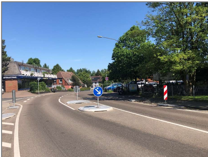
Abb.: Querungsstelle im Andersenring