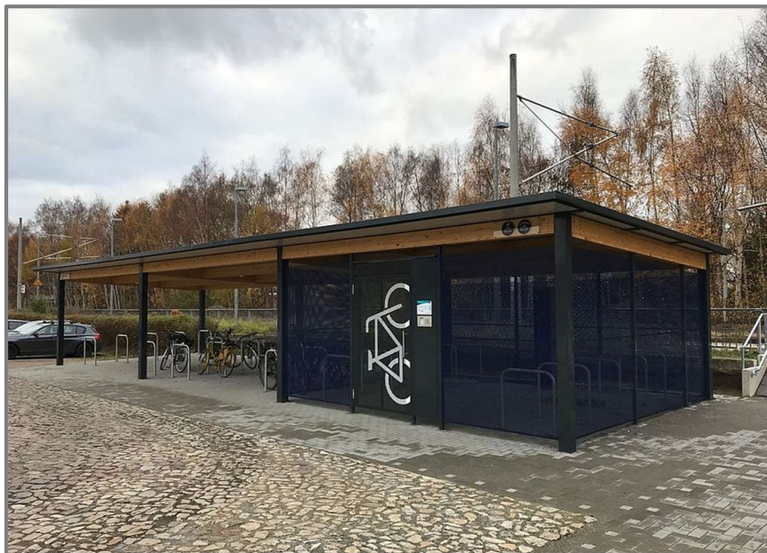
Abb.: Bike+Ride-Anlage Lübeck Travemünde-Hafen