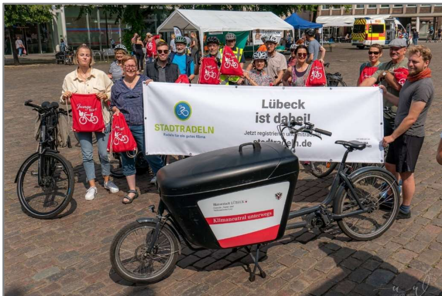
Abb.: Auftaktveranstaltung zur Aktion Stadtradeln 2023