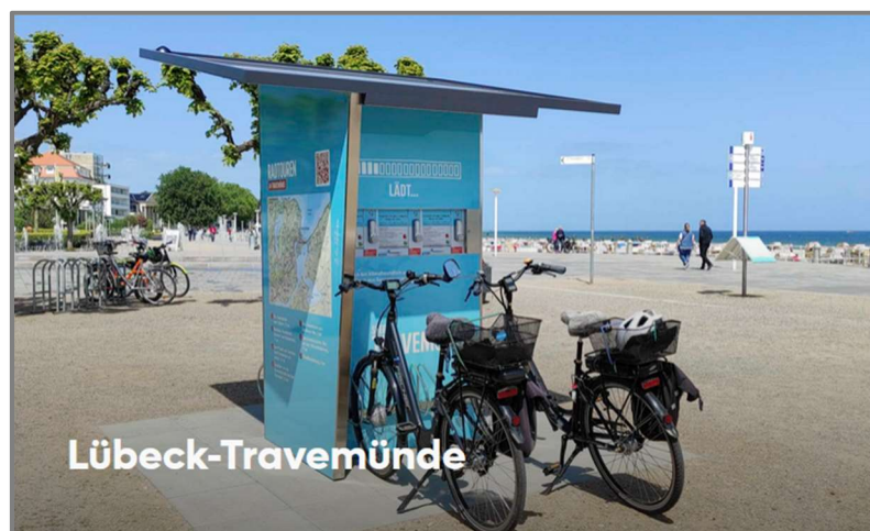
Abb.: E-Ladesäulen Strandpromenade