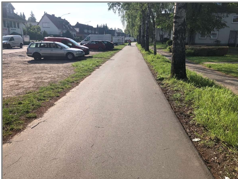
Abb.: Sanierter Zweirichtungsradweg Brandenbaumer Landstraße