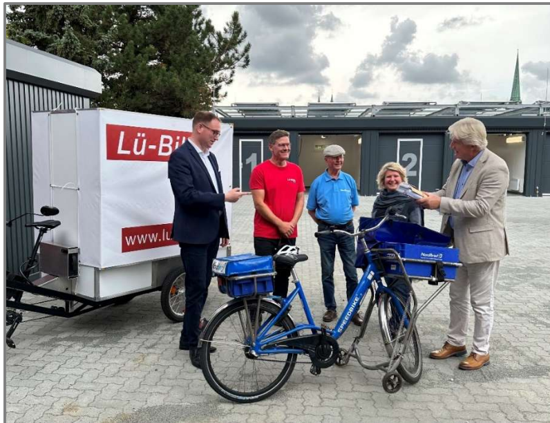
Abb.: Eröffnung des Mikro-Depots in der Falkenstraße