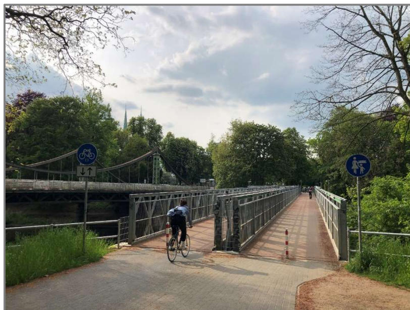
Abb.: Ersatzbrücken für den Fuß- und Radverkehr für die Mühlentorbrücke