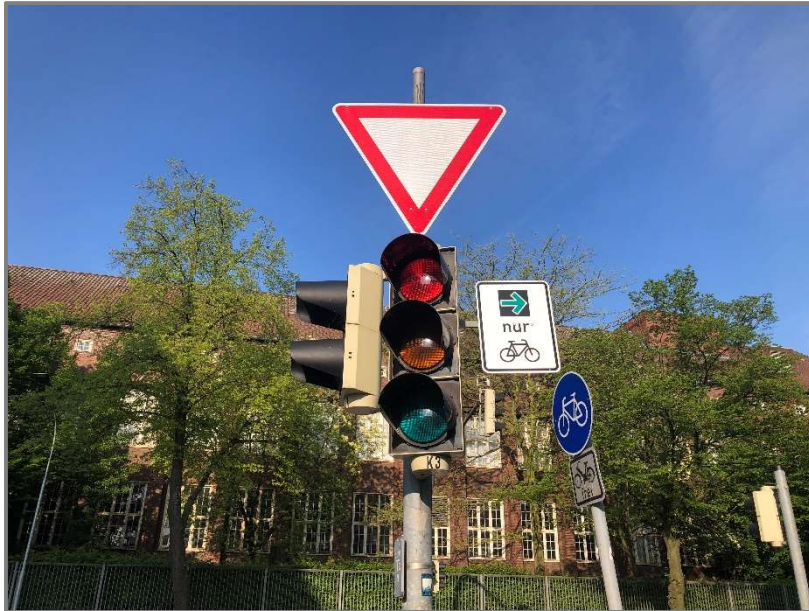
Abb.: Grünpfeil für den Radverkehr in der Wielandstraße/Lachswehrallee