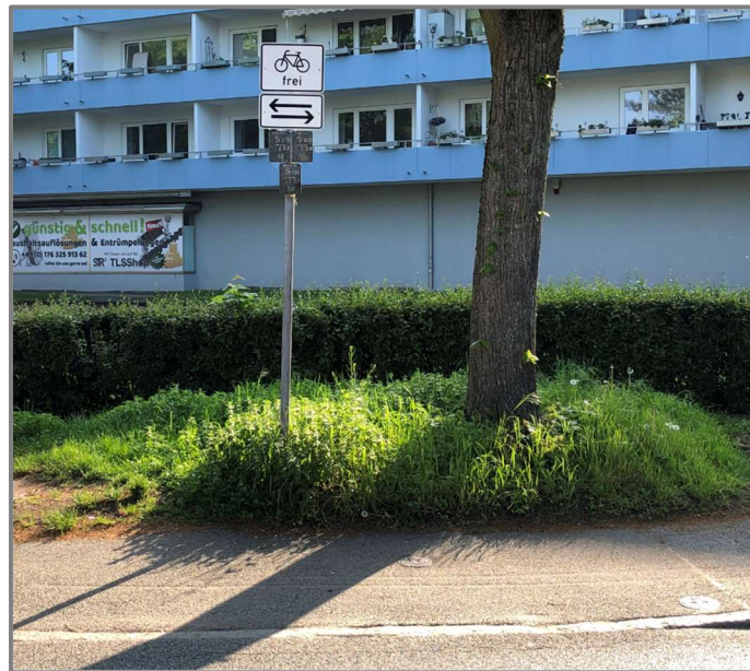
Abb.: Aufhebung der Radwegbenutzungspflicht im Marliring