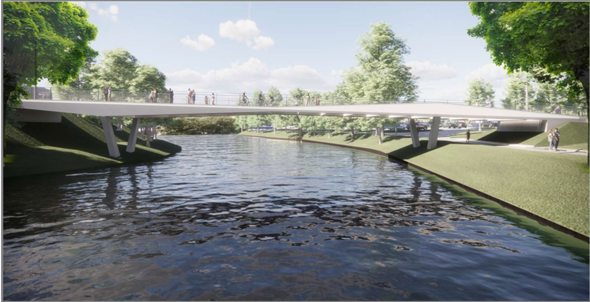
Abb.: Visualisierung Stadtgrabenbrücke