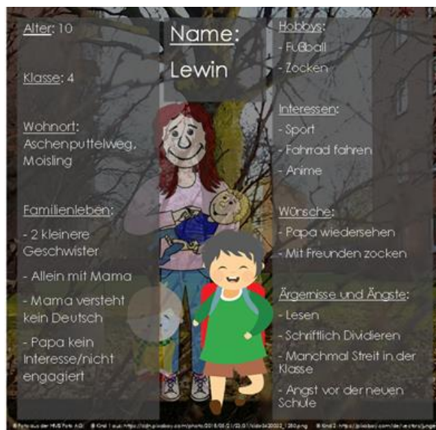
Abbildung 1: Persona Lewin 2

Um den Besonderheiten des Standortes Moisling gerecht werden zu können, haben wir uns mit verschiedensten Akteuren aus dem Stadtteil auf die Suche nach einer gemeinsamen Vision gemacht. Hierbei haben wir uns der Methode „Persona“ bedient. Bei dieser Methode geht es darum sich eine Person mit verschiedenen typischen Eigenschaften auszudenken und dann bei allen Entscheidungen diese Person vordergründig zu berücksichtigen. So bleibt der Fokus stets bei dieser Person. Unsere Persona heißt Lewin und wird in Abbildung 1 hier vorgestellt.