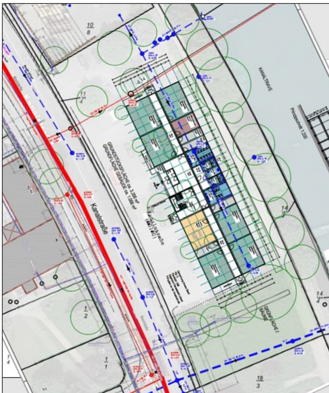
Bild 2: Darstellung des Flächenbedarfs im Bereich von Parkplatz P1

Eine Ampelanlage für Fußgänger:innen ist unmittelbar vor dem Grundstück vorhanden und ermöglicht die sichere Querung der Kanalstraße.