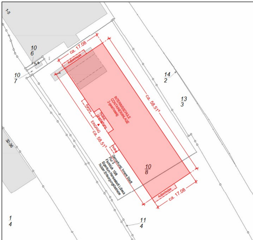
Bild 1: Darstellung des Flächenbedarfs im Bereich des ehem. Wertstoffhofes