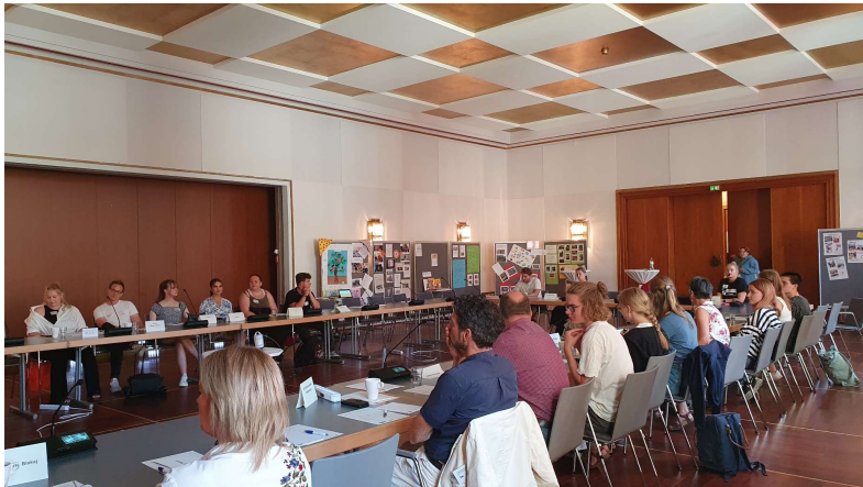
Regionaltreffen Lübeck September 2023