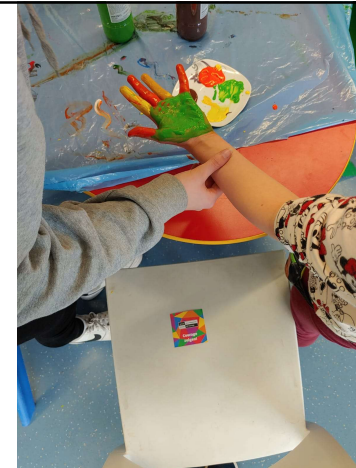
Botschafterinnen aus der Holstentor-Gemeinschaftsschule in der Grundschule am Koggenweg