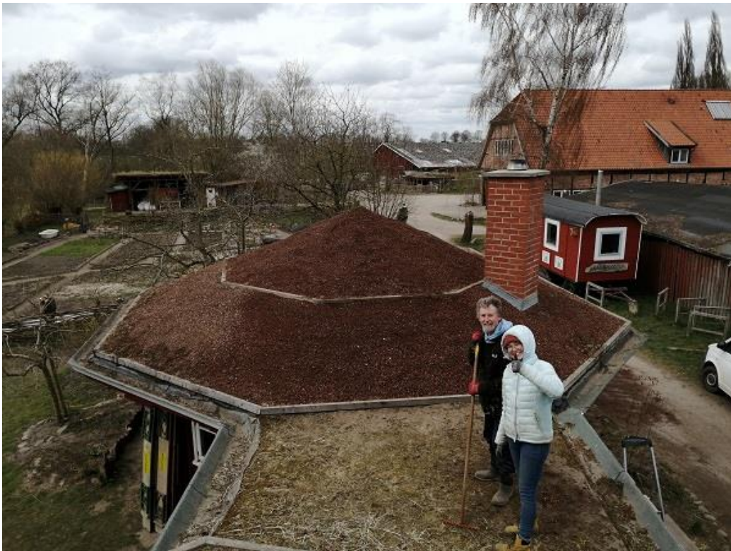
Nur zwei der vielen Helfer bei der Dachbegrünung

Anschließend hat das gesamte Hof Team in zwei gemeinsamen Aktionen nicht nur das Gründach für diesen Pavillon, sondern auch das Schutzdach vom Lehmofen und die Dächer der drei zusammenhängenden Pavillons erneuert.