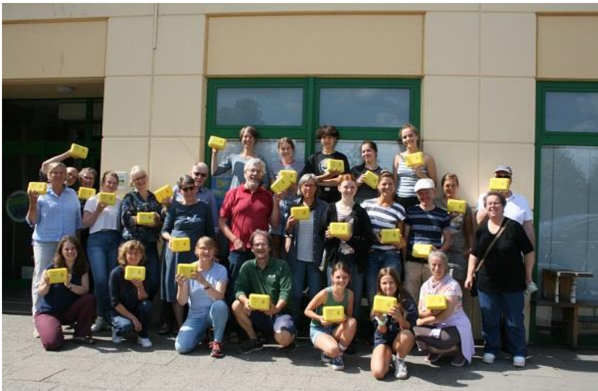
Viele fleißige Helfer bei der Bio-Brotbox Aktion

Im August konnten wir die Bio-Brotbox Aktion mit Hilfe von rund 30 Ehrenamtlichen durchführen. Wie schon im letzten Jahr wurde an einem Sonntag auf dem Parkdeck der EVG-Landwege in der Kanalstraße gepackt. 2700 Boxen wurden anschließend am Montag an alle Erstklässler der Lübecker Grundschulen ausgeliefert. Danke nochmal an dieser Stelle allen Mitwirkenden und Sponsoren!