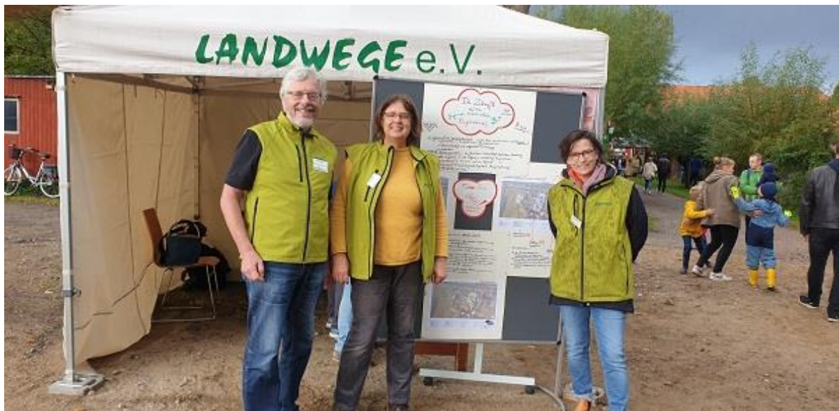
Auf dem Landwege Erlebnistag gab es viele Informationen zur Zukunft des Hofes

Viele, z.T. langjährige Kooperationen konnten wieder in alter Form weitergeführt werden. Dazu gehören das Psychomotorik Angebot der Ergotherapiepraxis Wischlitzky , eine Nachmittagsgruppe von Kinderwege , die Ferienfreizeiten der Stadtwerke und Exeo , Das „Grüne Klassenzimmer“ der Dorothea-Schlözer-Schule (Ausbildung SPA) und auch die VHS -Kurse zum Thema Kochen/Ernährung in der Lehrküche wurden nach den Sommerferien wieder gestartet.