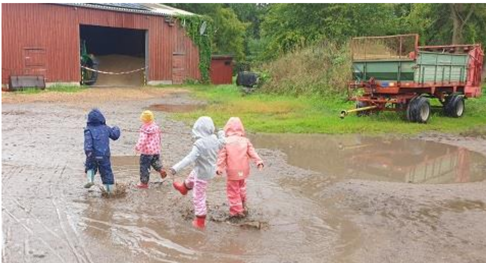
Zuviel Wasser im Frühjahr in der Landwirtschaft, aber Freude bei den Kindern

Im Frühjahr sahen wir uns mit überschwemmten Feldern durch Starkregen konfrontiert und Schäden am Gewächshaus und an vielen Dächern auf dem Hof waren durch extreme Stürme zu verzeichnen. Es folgte der Sommer 2022 mit Hitzewellen und -rekorden sowie der langen Trockenheit. Dieser Sommer hat hoffentlich auch die letzten Skeptiker überzeugt: Die globale Erderwärmung, die nicht mehr zu leugnen ist, ist vom Menschen gemacht. Die Schüler und Schülerinnen konnten dies alles auf den Äckern und dem Hof hautnah erleben. Im Frühjahr tiefe Pfützen, ein abgedecktes Gewächshaus, umgestürzte Bäume. Im Sommer rissige Erde, vertrocknetes Getreide und eine schlechte Kartoffelernte.