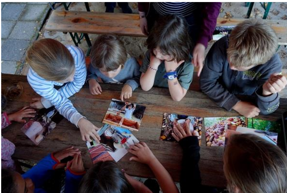
Kakaomodul: Wie und wo wachsen die Kakaobohnen?

Im elften Jahr läuft das Ernährungsprojekt „Ein Jahr in 24 Stunden“ , gefördert durch die Possehl-Stiftung, die gemeinnützige Sparkassenstiftung zu Lübeck, den Wessel-Stiftungen und