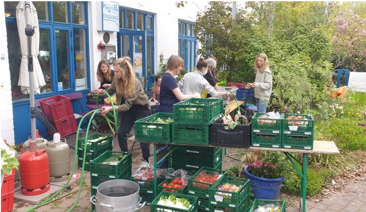
Schnippeldisko: Draußen wird das Gemüse gewaschen und gekocht, drinnen geschnippelt und getanzt

Werkhof feiern. Gemeinsam wurde fleißig gerettetes Gemüse und Obst geschnippelt, verkocht oder zu leckeren Salaten verarbeitet und gegessen, um anschließend zu den Beats der Gruppe "Leo in the Lioncage" zu tanzen. Eine sehr gelungene Veranstaltung nach der langen Pause.