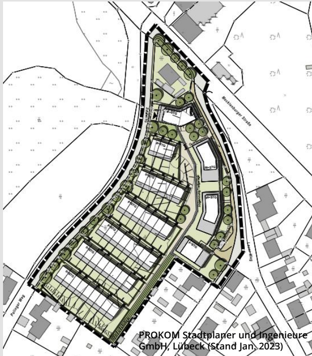
PROKOM Stadtplaner und Ingenieure GmbH, Lübeck (Stand Jan. 2023)