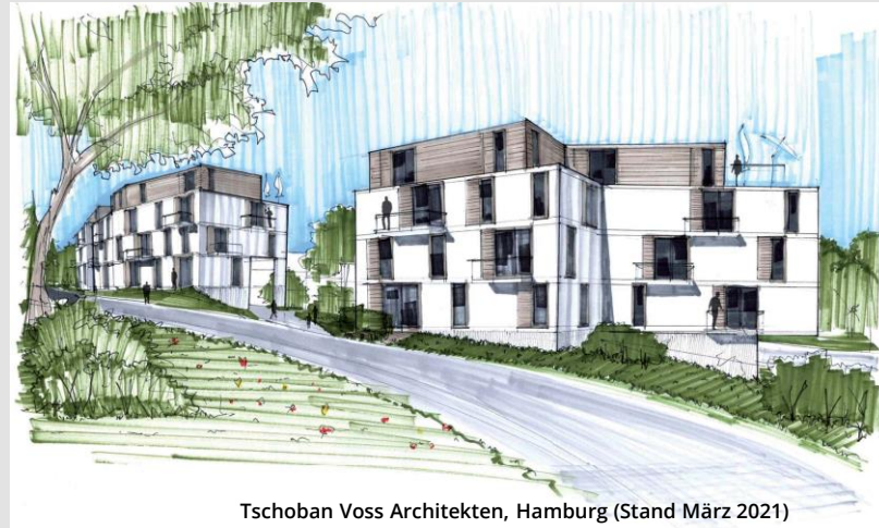
Tschoban Voss Architekten, Hamburg (Stand März 2021)