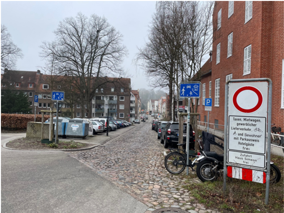
Abbildung 2 Vorschriftzeichen Nr. 250 nach Anlage 2 (zu § 41 Absatz 1 StVO) „Verbot für Fahrzeuge aller Art“ und Zusatzzeichen (Hartengrube).