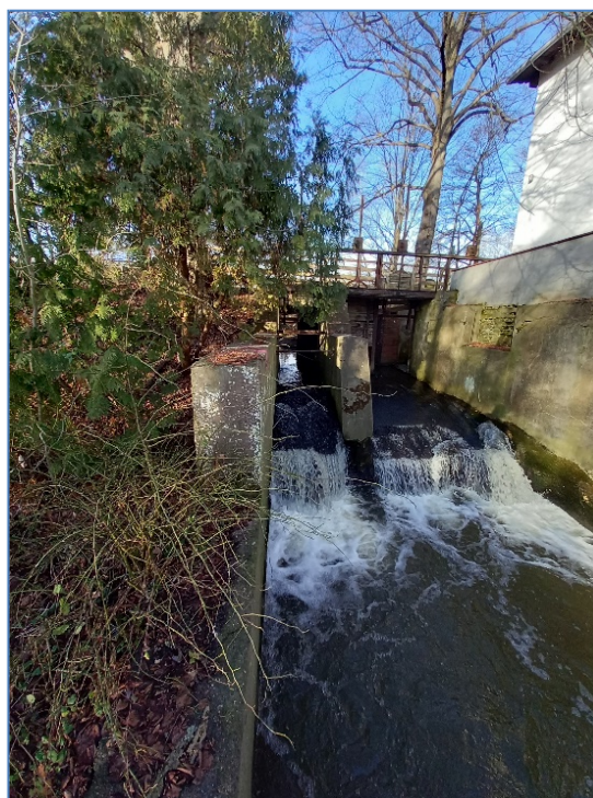
Abb. Seitenansicht mit Absturz- und Trogbauwerk

Das Bauwerk weist erhebliche Schäden (Betonabplatzungen, Rissbildungen, korrodierende Bewehrung) an den Unterbauten und der Holzkonstruktion des Überbaus auf. Die Dauerhaftigkeit und somit auch die Standsicherheit und Verkehrssicherheit des Bauwerks sind nur noch kurzfristig gegeben.