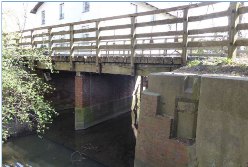
Abb. Seitenansicht Brandenmühle