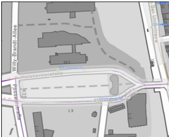
Abbildung 5 - Layer Buslinien/Haltestellen

Durch den Einsatz unterschiedlicher Karten-Layer in Roads kann die Stadtkarte bzw. das Luftbild um weitere Informationen, wie zum Beispiel Buslinien, Haltestellen oder Zustände der Verkehrswege aus Befahrungen, ergänzt werden. Auch die Infrastruktur, wie zum Beispiel die Straßenbeleuchtung, kann dargestellt werden.