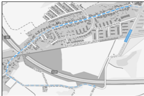
Abbildung 2 - Maßnahme Büssauer Brücke

Die Abteilung Brückenbau hat zudem ein Übersichts-konzept vorliegen, woraus hervorgeht, welche Brücken nach Möglichkeit gleichzeitig oder gerade nicht gleichzeitig bearbeitet werden sollten, um Behinderungen für die Verkehrsteilnehmenden so gering wie möglich ausfallen zu lassen. Darüber hinaus wird bei Maßnahmen, bei denen massive Einschränkungen für den Verkehr zu erwarten sind, ein gesondertes Verkehrskonzept erstellt, wie im Beispiel der Bahnhofsbrücke mit der Vorlage VO/2020/08653.