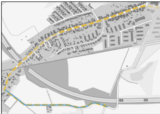
Abbildung 1 - Maßnahme Am Binsenhorst

ßensanierung. Den Projektleitenden war die Überschneidung bekannt, sodass eine terminliche Abstimmung im Vorwege erfolgt ist. An diesem Beispiel wird deutlich, wie wichtig es ist, alle Maßnahmen zentral zu erfassen, um derartige Überschneidungen zu erkennen und eine Abstimmung herbeizuführen und zu dokumentieren. Die Software Roads unterstützt diesen Prozess, indem auftretende Überschneidungen als Konflikt automatisch ausgegeben werden.