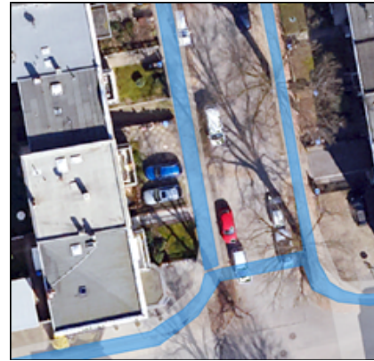
Abbildung 3 und 4 - Breitbandausbau findet in den Gehwegen statt