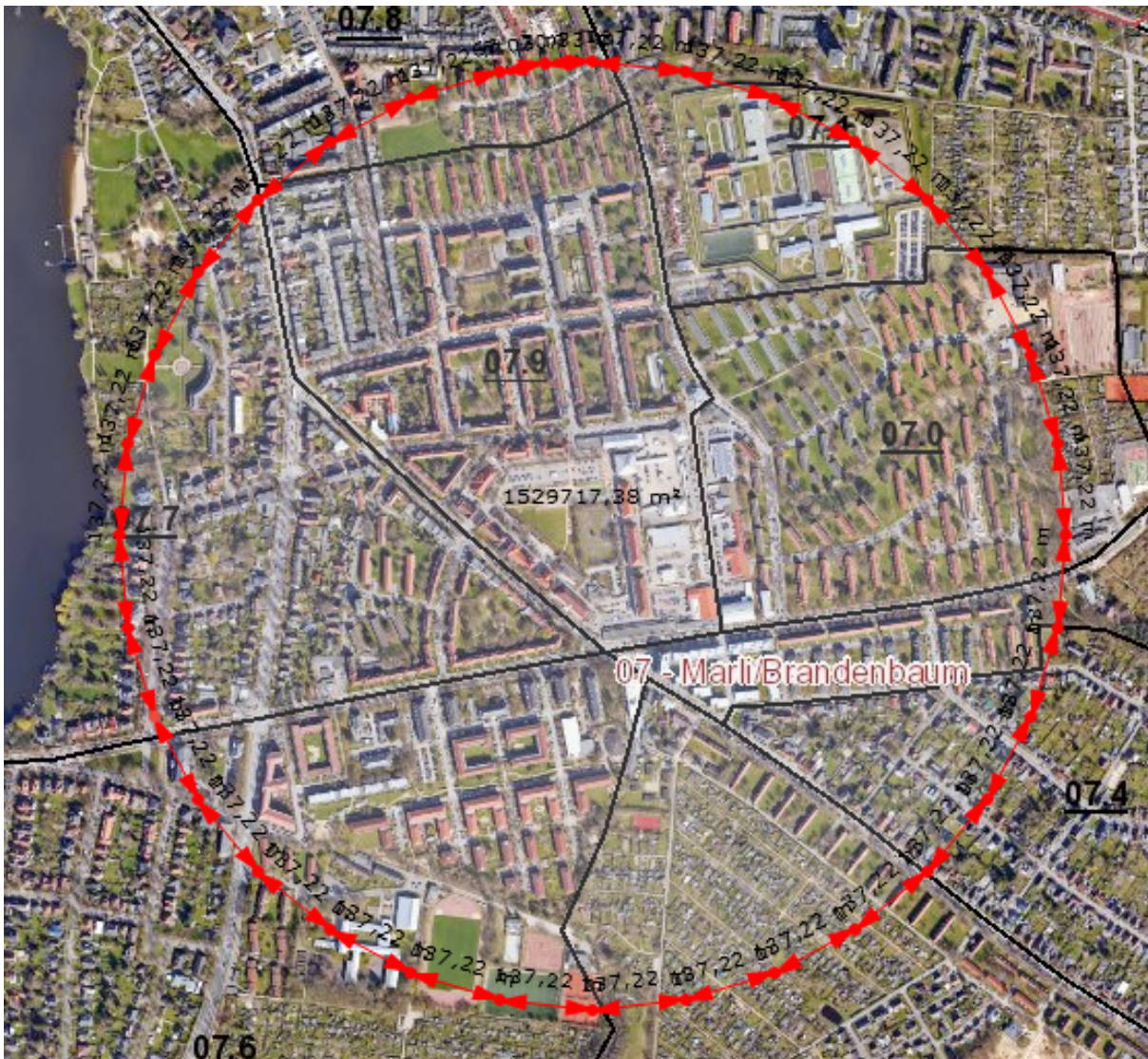
Abbildung 3: Luftbild 2019 von St. Getrud/ Marli mit Zentrum Jugendverkehrsschule und eingezeichnetem Radius von 700m

Der Meesenplatz erscheint auf Basis der oben dargestellten Bestandsaufnahme der geeignete Ort für die Etablierung einer Einrichtung der Jugendarbeit. Der Platz ist bereits ein beliebter Treffpunkt von Kindern und Jugendlichen, die dort versuchen ihre Freizeit zu gestalten. Darüber hinaus bildet der Meesenplatz ein geografisches Zentrum für die umliegenden Wohnbebauungen.