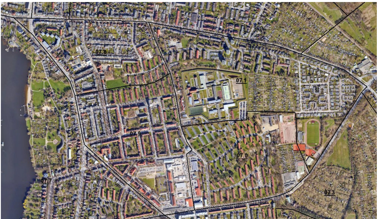
Abbildung 2: Der Sozialraum Marli (stat. Bezirke 7.0, 7.1, 7.8, 7.9,) im Luftbild

Der Stadtbezirk Marli/Brandenbaum wird von verschiedenen KfZ-Straßen eingeschlossen: im Norden von der Arnimstraße, westlich von der Marlistraße (B75) und südöstlich durch die Schlutuper Straße. Diese Achsen durchziehen auch die Wegeverbindungen von Kindern und Jugendlichen, sodass Marli als eigenständiger Sozialraum durch diese definiert werden kann. Der Sozialraum verfügt nur bedingt über Grünflächen, die von allen jungen Menschen und ihren Familien genutzt werden können. Auf Marli sind Stadterweiterungen in der Zwischen- und Nachkriegszeit des 20. Jahrhunderts mit Geschosswohnungsbau, teils als Sozialwohnungen und Einfamilienhäuser entstanden, die auch heute noch das Bild des Sozialraums prägen. Das Verkehrsaufkommen ist insbesondere auf der Marlistraße (B75) und den Aus-