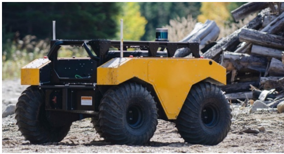
Abb. 1: exemplarisches UGV (5G tauglich) – Sensorik und Kamerasysteme fehlen