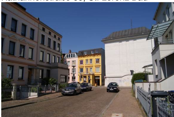
Warendorpstraße 13, Bunker