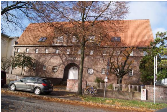
Katharinenstraße 65, St. Lorenz Bad