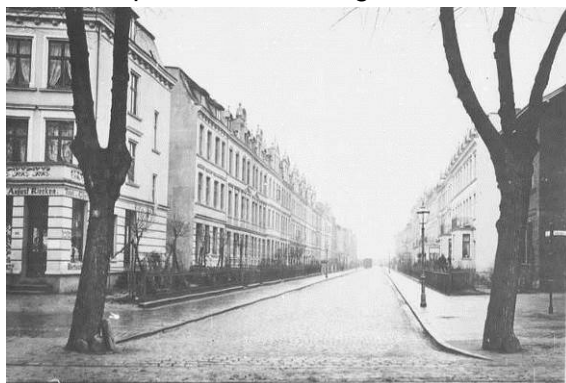
Mündung Westhoffstraße(Foto um 1910)