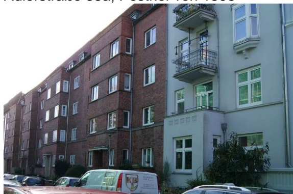
Marquardstraße 13, rotes Wohnhaus