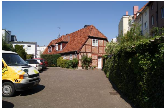
Adlerstraße 35a, Pesthof von 1598