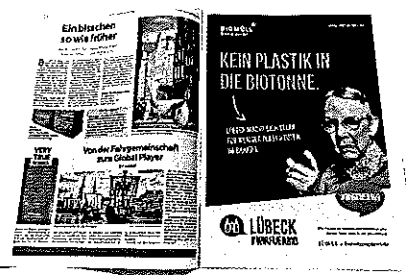
... Anzeige und unser Entsorgungsmagazin

18. August 2018 August 18, 2018 Für Fachmarkt & B.