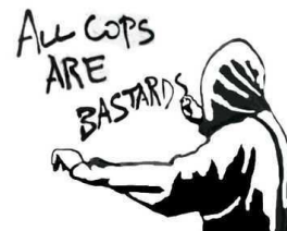
Fanprojekte nach dem NKSS