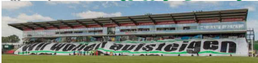
Fanprojekte nach dem NKSS