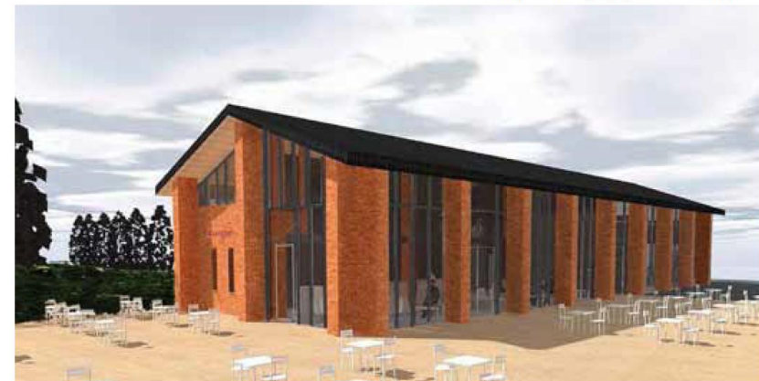
Perspektive „Junge + Touristinfo“

Der Beirat empfiehlt für die Neubauten auf den Travewiesen einen Realisierungswettbewerb durchzuführen, der in einem landschaftsplanerischen Teil auch dazu beitragen kann, die Flächenansprüche der Außengastronomie und den Hochwasserschutz mit dem angestrebten Bild der ‚Schuppen auf der Wiese‘ in Einklang zu bringen.