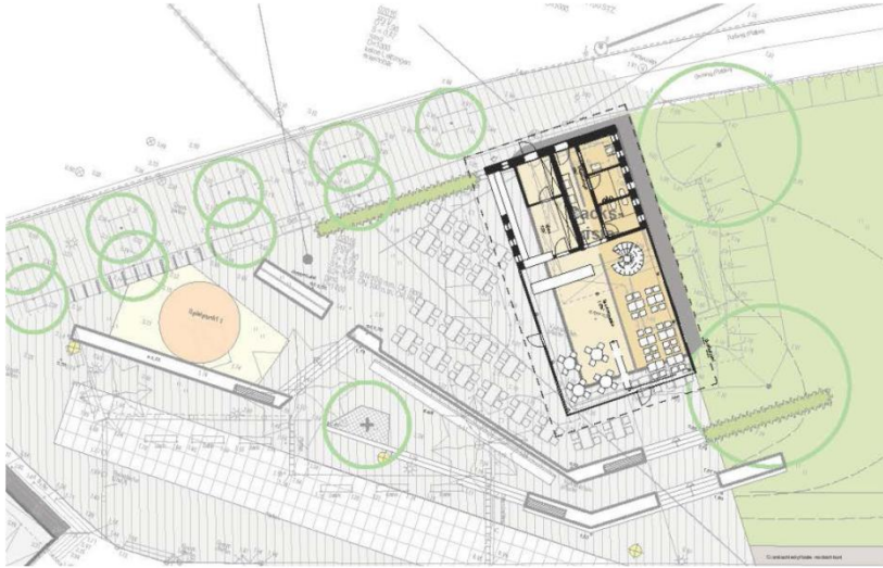
Lageplan Neuplanung „Backskiste“