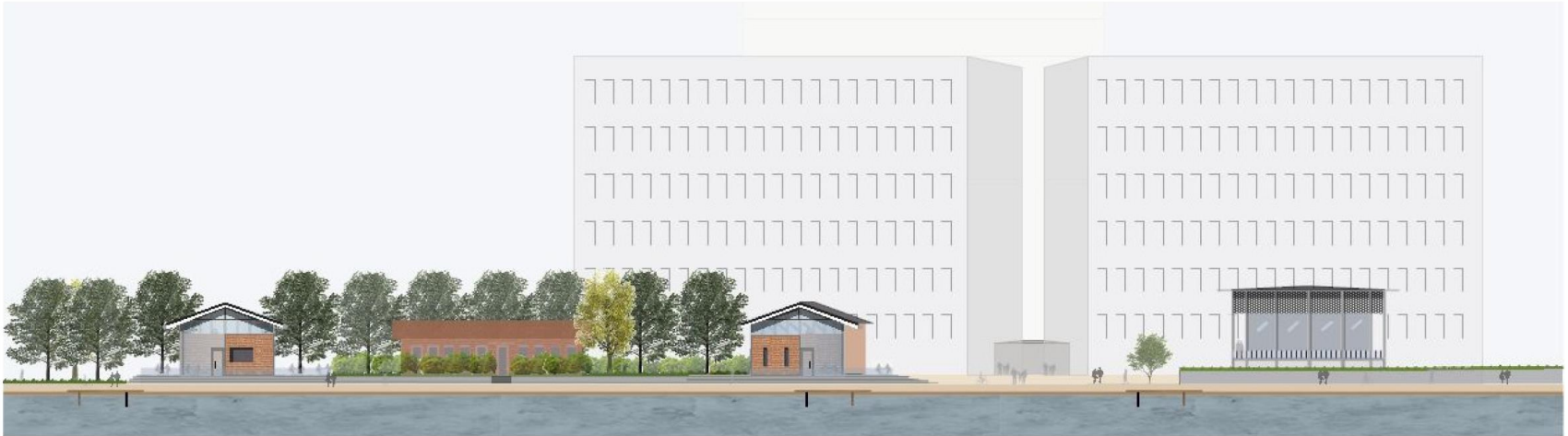
Ansicht vom Priwall