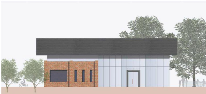
Hansestadt Lübeck | Gestaltungs- und Welterbeirat | 54. Sitzung 16./17.11.17.2017