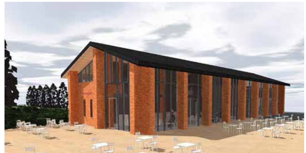
Perspektive „Junge + Touristinfo“

Die in der Sitzung vorgestellten Projekte für drei Neubauten sind im Hinblick auf die hier beschriebenen Kriterien in mehrfacher Hinsicht problematisch. Die Lage der geplanten Bauwerke führt –trotz des in einem Fall bestehenden Baurechts– teilweise zu nachteiligen Gruppenbildungen (Fisch Paul, Wasserschutzpolizei und Junge- Die Bäckerei). Die Höhe der i.d.R. zweigeschossigen Bauwerke erscheint durchgängig zu groß und trotz des Versuchs, die Zweigeschossigkeit in der äußeren Erscheinung zu kaschieren, kann der angestrebte Charakter einer ‚schuppenhaften‘ Bildes nicht erreicht werden.