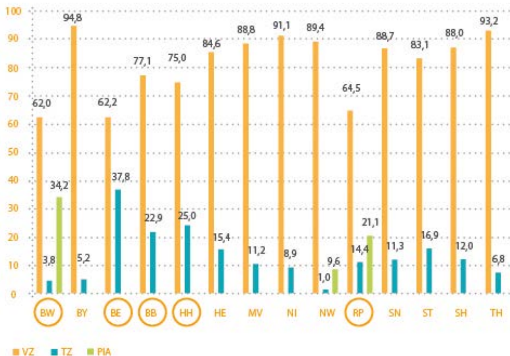
Abb. 5: Anteil der Fachschülerinnen und Fachschüler an einer Vollzeit-, (integrierten) Teilzeit- und praxisintegrierten Erzieher/innenausbildung im Schuljahr 2015/16 (ohne HB und SL)

Quelle: Landesämter für Statistik folgender Bundesländer: Baden-Württemberg, Bayern, Berlin, Brandenburg, Hamburg, Hessen, Mecklenburg-Vorpommern, Niedersachsen, Nordrhein-Westfalen, Rheinland-Pfalz, Sachsen, Sachsen-Anhalt, Schleswig-Holstein, Thüringen, eigene Berechnungen.