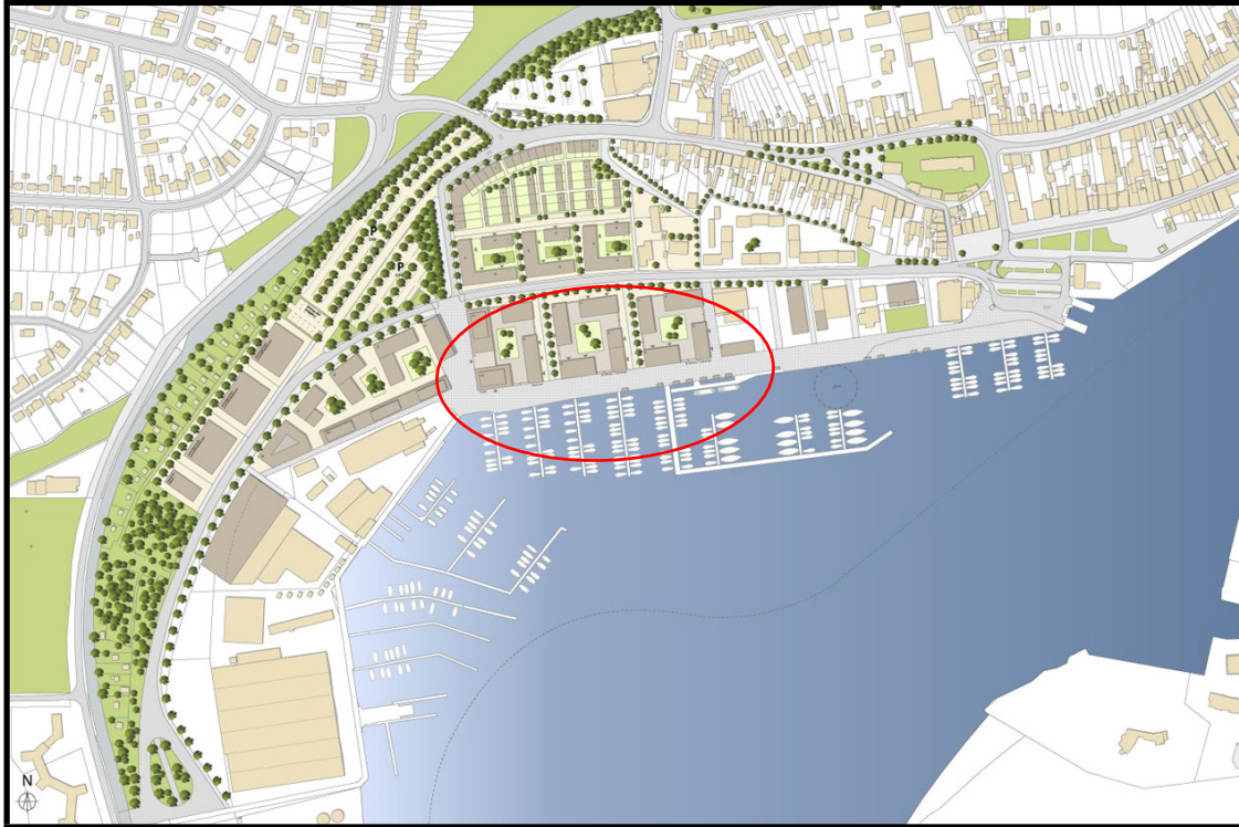
Fischereihafen Lübeck-Travemünde – Hafenquartier – städtebauliches Konzept

Für die Hafenzone (rote Ellipse) mit allen Einzelmaßnahmen im und am Wasser, die Verkehrsflächen und Uferbauwerke hat die Lübeck Port Authority die Bauherrenfunktion.