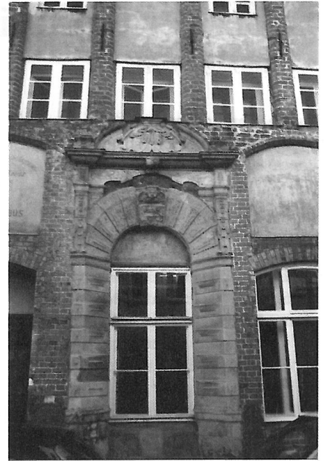
Portal Schildstr. 10

Von den erhaltenen Portalen sind vier in bedenklichem Zustand, besonders jeweils im unteren Drittel zerfällt die Steinsubstanz, Konservierungs- und Restaurierungsmaßnahmen sind dringend geboten. Die Restaurierung der Portale des Tesdorpshauses, Mengstraße 66–70, und das vom Amtshaus der Krämerkompanie, Braunstraße 1–3, sollen endlich in diesem Jahr in Angriff genommen werden. Das Schicksal der beiden in städtischem Eigentum befindlichen Portale im Domhof und in der Schildstraße 10 ist noch ungewiss. Um den weiteren Verfall zu stoppen, ist auf baldige Hilfe von Lübecker Stif-