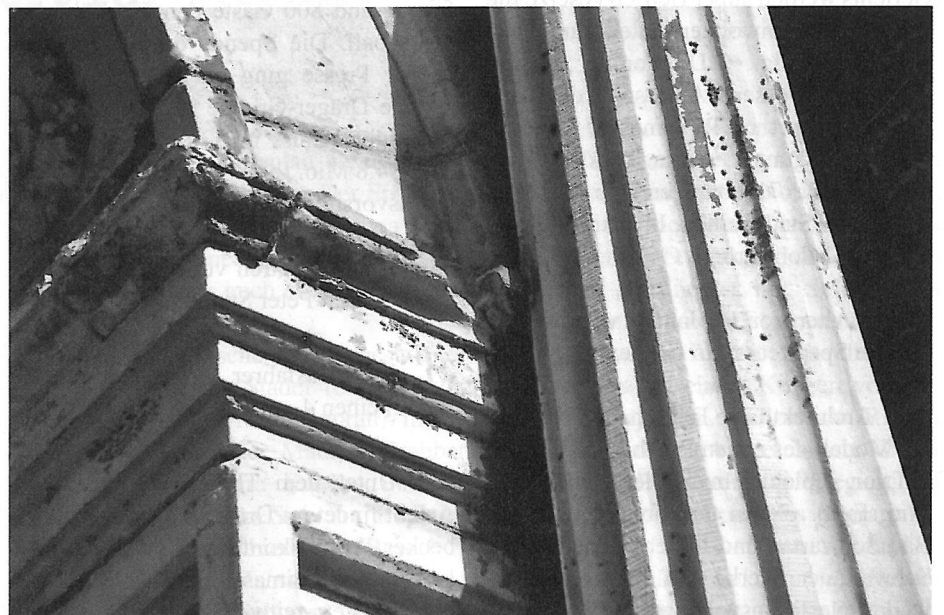
Portal Mengstr. 26, Baudetails, sanierungsbedürftig (siehe auch kleine Abbildung)