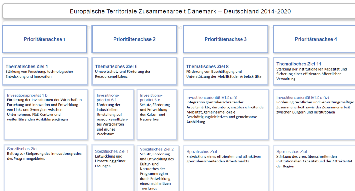
Abbildung 4: INTERREG 5A Programminhalte

Momentan arbeitet die INTERREG Arbeitsgruppe an der inhaltlichen Ausgestaltung des Programms. Das daraus entstehende Operationelle Programm wird dann gemeinsam von den finanziell verantwortlichen Gebietskörperschaften verabschiedet (Konsultationsprozess) und sollte bis Ende 2013/Anfang 2014 bei der EU-Kommission eingereicht werden. Die EU entscheidet in der Regel innerhalb von 6 Monaten und genehmigt das Programm.