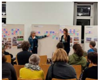
Kick-Off-Veranstaltung der Netzwerktreffen für lokale Akteur:innen (links), Themen-Workshop zur Raumplanung (rechts)